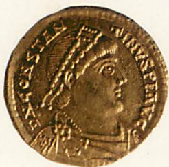
Gouden munt van keizer Constantijn III.

Dit zilveren vaatwerk vertegenwoordigde een belangrijk statussymbool in het laat-Romeinse Rijk. Tevens fungeerde het als een belangrijk geschenkobject van de Staat in het diplomatieke verkeer met lagere overheden, maar ook met Germaanse leiders binnen en buiten de rijksgrens. De Notitia Dignitatum (een belangrijk document over de organisatie van het Romeinse staatsapparaat rond 400) vermeldt het bestaan van speciale functionarissen belast met het doen van schenkingen namens de keizer; hun ambtsinsigne toont zakken gouden munten alsook grote zilveren schalen gevuld met goudstukken. Verondersteld wordt dat het schaalfragment gevonden in Pey oorspronkelijk uit zo'n keizerlijke gift afkomstig is en een geschenkobject van het hoogste niveau betreft, afkomstig uit de directe omgeving van de keizer. Hoe kan nu, tegen deze achtergrond, het kapot knippen van zo'n kostbaar stuk worden begrepen?