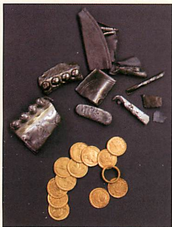
Overzicht van de goudschat bestaande uit een ensemble van munten, een ring, een zilverbaar en fragmenten van zilveren vaatwerk.

De begraver van de schat van Pey zou daarmee zeer wel een Germaanse officier in Romeinse dienst hebben kunnen zijn die aan het hof van Constantijn III goede relaties had. Het goud en zilver kan dan als beloning voor zijn diensten hebben gediend. De schat kan kort na het jaar 411 begraven zijn tijdens de crisis die ontstond na de nederlaag en dood van Constantijn III in Zuid-Gallië. Zijn Germaanse bondgenoten kwamen er nu alleen voor te staan en konden zonder steun van Rome de druk van nieuwe invallen niet meer weerstaan. De schat reflecteert ultieme pogingen van het Romeinse gezag om vooral de Maas- en Rijnvallei te controleren en van daaruit greep te krijgen op de aangrenzende regio's.