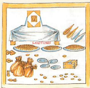
Embleem van keizerlijke functionarissen belast met het doen van schenkingen namens de keizer, afkomstig uit de Notitia Dignitatum.

Dit zilveren vaatwerk vertegenwoordigde een belangrijk statussymbool in het laat-Romeinse Rijk. Tevens fungeerde het als een belangrijk geschenkobject van de Staat in het diplomatieke verkeer met lagere overheden, maar ook met Germaanse leiders binnen en buiten de rijksgrens. De Notitia Dignitatum (een belangrijk document over de organisatie van het Romeinse staatsapparaat rond 400) vermeldt het bestaan van speciale functionarissen belast met het doen van schenkingen namens de keizer; hun ambtsinsigne toont zakken gouden munten alsook grote zilveren schalen gevuld met goudstukken. Verondersteld wordt dat het schaalfragment gevonden in Pey oorspronkelijk uit zo'n keizerlijke gift afkomstig is en een geschenkobject van het hoogste niveau betreft, afkomstig uit de directe omgeving van de keizer. Hoe kan nu, tegen deze achtergrond, het kapot knippen van zo'n kostbaar stuk worden begrepen?